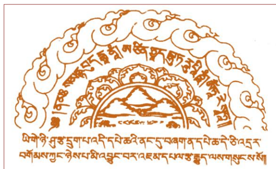
此咒置经书中可灭误跨之罪